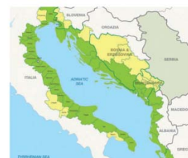
1. Area adriatica di riferimento