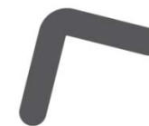
2. Stilizzazione grafica della forma