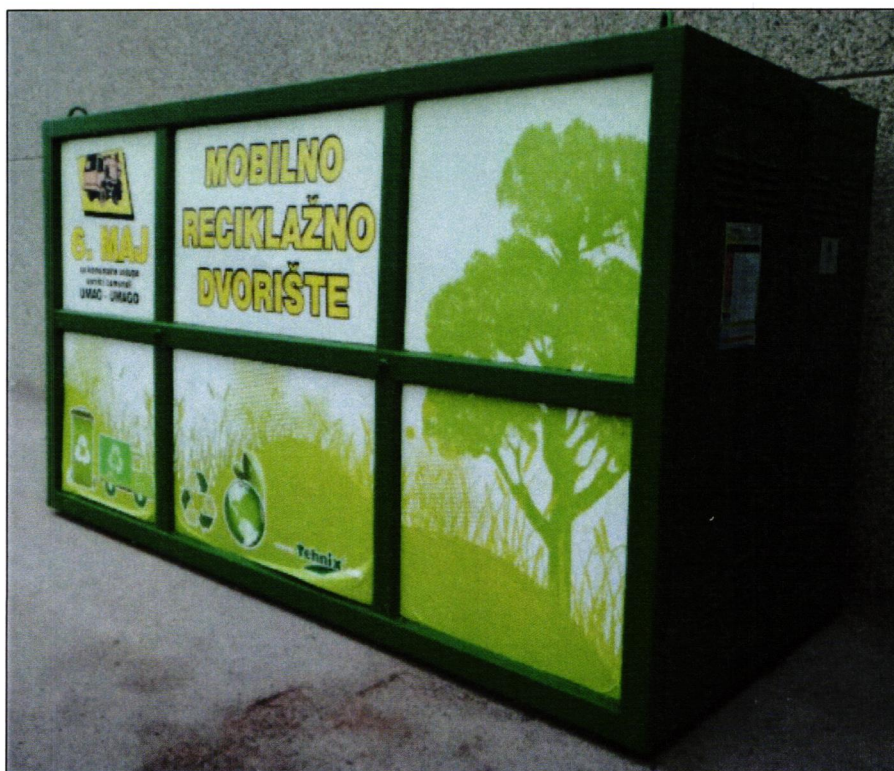
Slika 1. Mobilno reciklažno dvorište

Komunalna tvrtka je u posjedu mobilnog reciklažnog dvorišta i s kojim se na području Općine Grožnjan - Grisignana prije COVID 19 situacije pružala usluga prikupljanja otpada od strane građana. Mobilno reciklažno dvorište opremljeno je opremom za vaganje prikupljenog otpada te ima djelatnika koji je zadužen za vaganje, odlaganje i vođenje evidencija o posjedniku otpada. Odlaganje otpada je besplatno, a osoba koja donosi otpad mora pokazati osobnu iskaznicu djelatniku, kako bi upisao podatke o posjedniku otpada.